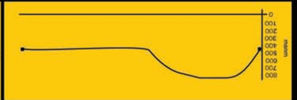
ETAPA 1: PORTADA NORTE - BAHIA SOLIS