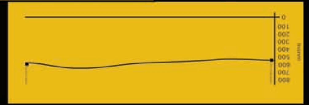
ETAPA 3: ARRAYANES - PUNTA MATTOS

ETAPA 6: VILLA FUTALAUFGUEN - PORTADA CENTRO