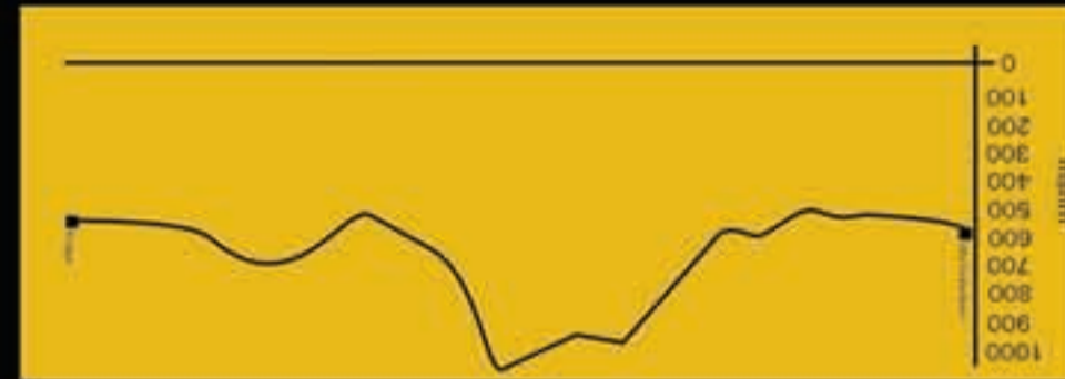
ETAPA 5: KRUGGER - VILLA FUTALAUFGUEN